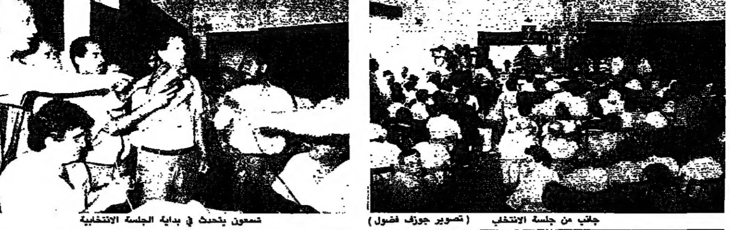
جانب من جلسة الانتخاب